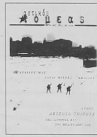
αστιγός τομέας δέλτα φεβρουάριος 1999 τεύχος 5 από δικτικά