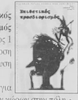
Επιθετικός προορισμός γενάρης '99 - τεύχος 1 περιοδική έκδοση ενάντια στην εκπαίδευση

Πώς το έγγραψε; Το θέμα δεν είναι αν ζούμε περισσότερο ή λιγότερο καλά. Αλλά ότι ζούμε μ' έναν τρόπο που μας διαφεύγει. Αλλάξτε το "μ' έναν τρόπο". Σ' ένα έγκλημα - είναι πιο σωστό.