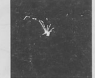
24 σελίδα από την Carthago

ΤΟ ΟΠΙ ΕΛΠΙΖΟΥΜΕ ΤΟ ΧΡΥΣΤΑΝΕ ΣΑΥΤΟΥΣ ΠΟΥ ΕΠΑΝΑΝΑΝ ΝΑ ΕΛΠΙΖΟΥΝ ΤΟ ΒΙΒΛΙΟ ΤΟΥ ΔΡΟΜΟΥ