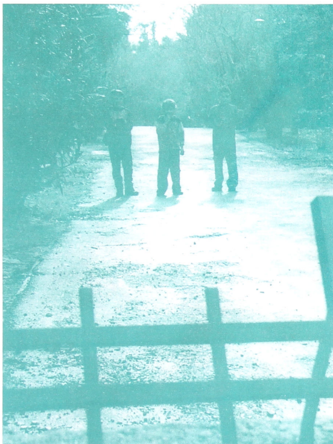
Φωτο: από το κλειστό εργοτάξιο της J&P ΑΒΑΕ, στο περιστερί 9/10, ύστερα από την παρέμβαση των οικοδόμων που δουλεύουν εκεί.