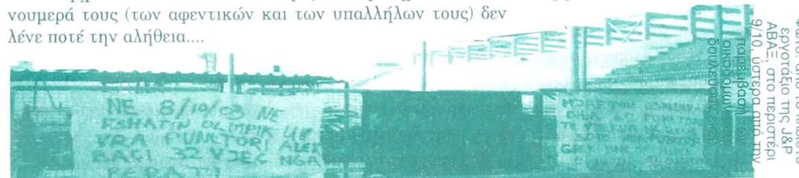
Φωτο: από το κλειστό εργοτάξιο της J&P ΑΒΑΕ, στο περιστερί 9/10, ύστερα από την παρέμβαση των οικοδόμων που δουλεύουν εκεί.