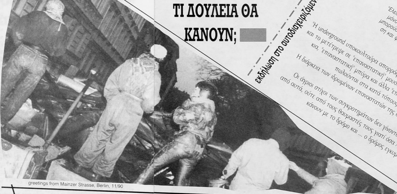
greetings from Mainzer Strasse, Berlin, 11/90

1η Μαΐου Επειδή η Πρωτομαγιά "δεν είναι αργία - είναι απεργία", και επειδή οι απεργίες ακόμα και οι συμβολικές βλάπτουν την ανάπτυξη της χώρας, γιαυτό φέτος το συνδικαλιστικό κίνημα σκέφτηκε να κάνει μια σαββατιάτικη βόλτα στον πλέον κραγμένο εργοδότη: την αμερικανική πρεσβεία. Τελικά υπάρχει κανένας που να μην χωράει εκεί, στη Βασιλίσσης Σοφίας; Ο πατριωτικός οίστρος ενώνει, βρίσκει εύκολοι στόχους, και όλα πάνε καλά. Το ότι πολλοί - πολλές που δουλεύουν έχουν γραμμένες αυτές τις τελετές και τους εργατοπαπάδες τους, είναι γεγονός - αλλά αυτό