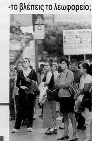
-το βλέπεις το λεωφορείο;