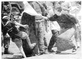
Νεαροί Ισραηλινοί προηλακίζουν γυναίκα μουσουλμάνα την ώρα που της «γίνεται έλεγχος» από στρατιώτες. Στη Χεβρώνα

Η θάλασσα της οργής ξεχύλισε, τόσο για τους Παλαιστίνιους όσο και για τον ισλαμικό διεθνισμό μέσα στο 2000. Όταν έγινε μια διεθνής ενοχλησμένη προσπάθεια να «κλείσει το παλαιστινιακό» με μια συμφωνία που θα νομιμοποιούσε πολλά από τα κατορθώματα του ισραηλινού κράτους στην διάρκεια του πολυχρόνου πολέμου του εναντίον των Παλαιστίνιων.