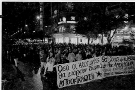
φωτογραφία και απόσπασμα της προκήρυξης από διαδήλωση που έγινε στη Θεσσαλονίκη στις 16/10