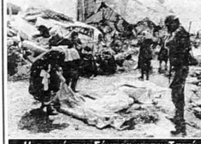
Η σφαγή στην Σάμπρα και την Τσατίλα, όπως και η σφαγή στην Σρεμπρένιτσα «βυθίζουν» σε εκατομμύρια πληθείους τα πολιτισμένα σχέδια για την «τύχη» τους.

Εν τέλει, αν εννοήσουμε τον καπιταλισμό σαν ένα απρόσωπο σύστημα σχέσεων και αξιών, πολύ γρήγορα ο ισλαμικός ριζοσπαστισμός θα ενεδίξει στην γοητεία του, κάνοντας τις αναγκαίες προσαρμογές και τροποποιήσεις στα ιδεολογικά δόγματά του. Εξάλλου δεν είναι ακριβώς ίδια η «καπιταλιστική ηθική» στην Ιαπωνία και στις ΗΠΑ για παράδειγμα – παραλλαγές επιτρέπονται και βοηθούν. Αλλά κάτι τέτοιο θα προϋποθέσει αποκατάσταση της ελεύθερης αγοράς παγκόσμια για τις πρώτες ύλες (αυτό που διακρίσσονταν αλλά φροβούνται στον βορρά...) δηλαδή «εθνική απελευθέρωση» του μουσουλμανικού (όπως και του λατινοαμερικάνικου, όπως και του αφρικανικού γενικό) κόσμου. Δημιουργία «ομαλών» ταξικών κοινωνιών (δηλαδή «ομαλή συσσώρευση δι' εαυτών») και καλύτερη «εσωτερική» κατανομή του πλούτου. Στην βάση αυτή τα μεταρρυθμιστικά κινήματα θα έρχονταν πολύ γρήγορα.