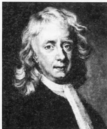
Isaac Newton (1643 - 1727)

Ο "μπούφος" μαθητής που έγινε ένας από τους μεγαλύτερους φυσικούς / μαθηματικούς στην ιστορία της Δύσης. Η αυστηρή προτεσταντική του πηκή τον έφερε σε σύγκρουση ακόμα και με τον βασιλιά James II.