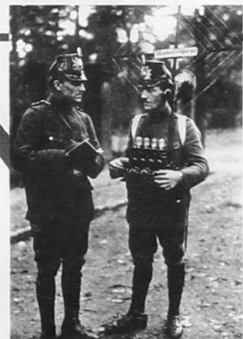
Λοιπόν κοίτα το σχέδιο: στην αρχή θα πας και θα τους κάνεις μπουαααα, είμαι μια τερσίσια αρχήνη και θα σας φάωωω! Άμα δε χεστούν και δεν παραδοθούν, κι αρχίσουν να σε κοροϊδεύουν, στέλνεις σήμα και σκάω εγώ....